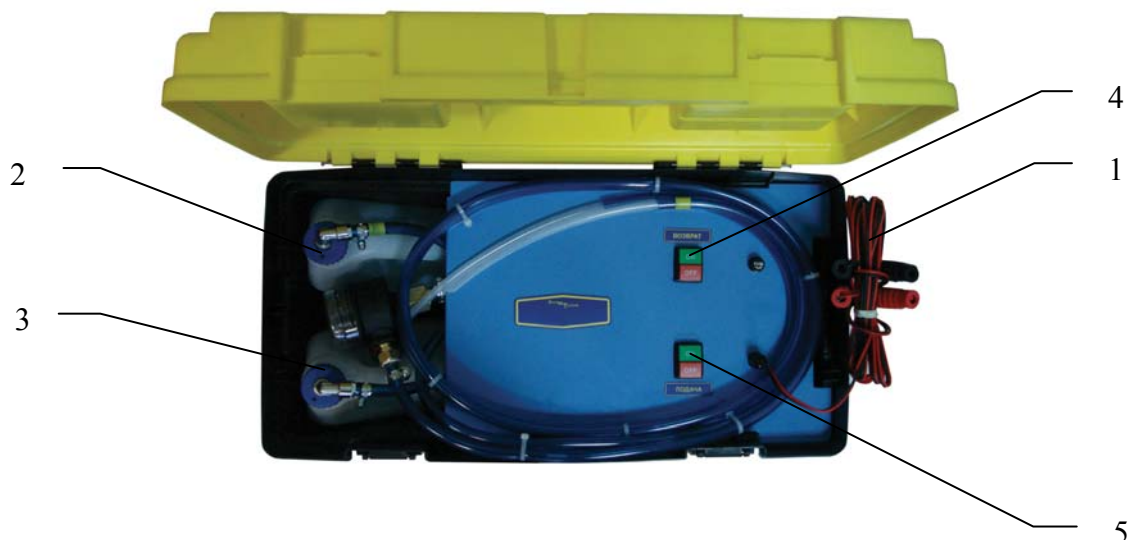
Рис.2 (вид сверху)