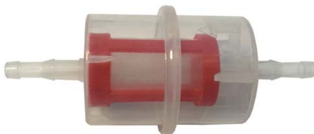
Рис.4 (неразборный сменный фильтр)